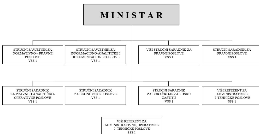
Slika 1. Organizaciona shema Ministarstva za boračka pitanja BPK Goražde

Takođe, prostorije u kojim je smješteno Ministarstvo nisu dovoljne za trenutni broj uposlenih a neophodno je i izvršiti nabavku novog kancelarijskog namještaja te dodatne opreme kako bi se unaprijedili uslovi za neometan i efikasan rad Ministarstva.